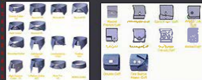
Kragen & Manschetten

Mehr Infos finden Sie auf der Webseite: Fragen? Verwenden Sie das Kontaktformular www.my-design-swiss.ch